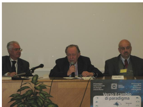
La relazione dell'On. Falco Accame (ex Presidente della Commissione Parlamentare Difesa) e quella del Rettore della Accademia Internazionale Costantiniana delle Scienze prof. Paolo Goliani