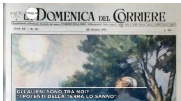
Lo strano fenomeno solare di Papa Pio XII

Per calmare i suoi ospiti la conduttrice Federica PANICUCCI lancia un'altra scheda video che riguarda invece le dichiarazioni sugli UFO fatte dai Potenti della Terra come OBAMA, MEDVEDED e Papa Pio XII.