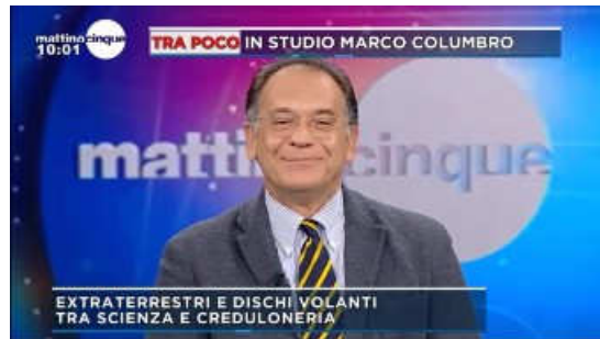
Alessandro CECCHI PAONE (giornalista)