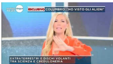
Federica PANICUCCI (conduttrice)