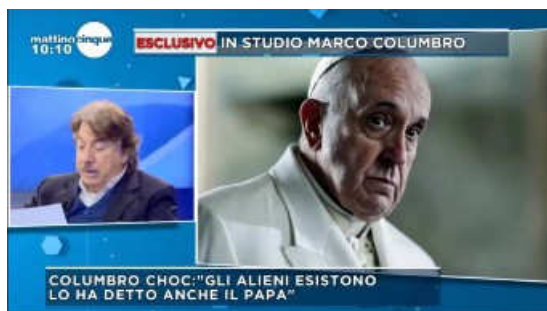
Papa Francesco avrebbe parlato degli alieni

Il popolare ex-conduttore televisivo (uscito dal piccolo schermo dopo la sua malattia nel 2001) ha sostenuto di non essere un "credente negli UFO" ma di avere una personale convinzione che non siamo soli nell'Universo. Leggendo alcuni fogli di appunti COLUMBRO, con pronuncia incerta, ha nominato alcuni personaggi molto noti dell'ufologia, come l'ex-Ministro della Difesa e dei Trasporti canadese Paul HELLYER il quale girerebbe il mondo affermando che "gli alieni occupano 6 poltrone nel Congresso americano. Sarebbe ora che i Capi di Stato rivelassero ai cittadini le notizie sugli UFO che nascondono da decenni". COLUMBRO ha poi citato il programma AATIP del Pentagono il cui ex-direttore Luis ELIZONDO si sarebbe detto convinto che "Non siamo soli, ci sono le prove!", per poi affermare che anche Papa Francesco nel 2014 avrebbe detto che "Gesù è un alieno".