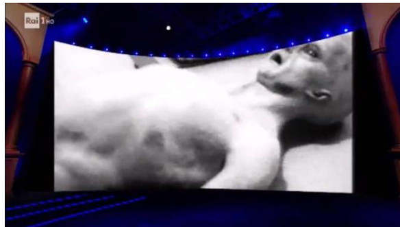
IL SANTILLI FOOTAGE

Dalla Luna allo spazio Piero ANGELA passa a "la storia dell'UFO tenuto segreto negli Stati Uniti" . Per il segretario del CICAP si tratta dell'altra grande leggenda metropolitana che circola sul web : "nel 1947 un presunto UFO sarebbe precipitato a Roswell nel new Mexico ed una volta recuperato dall'Esercito sarebbe stato tenuto nascosto all'interno dell'AREA 51, una base militare super-segreta dove sicuramente ci sono molti velivoli segreti ma si tratta di esperimenti militari, niente Dischi Volanti !!" .