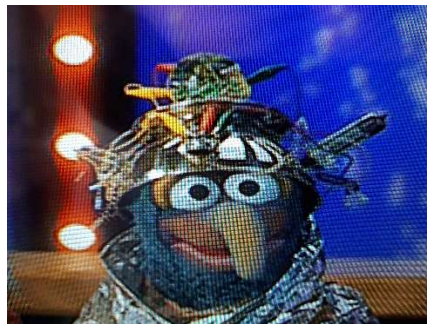
Gonzo, il muppet extraterrestre

Dopo tante delusioni cinematografiche, adesso vogliamo parlarvi di qualcosa che invece vi farà riappacificare con il buon cinema di fantascienza !! Chi non conosce Kermit, Piggy, Fozzie e Gonzo, ovvero i MUPPETS, le divertentissime marionette create da Jim HENSON (1936-1990) e portate in Italia dalla RAI TV nel 1977 ??? In questo divertentissimo film del 2001 c'è tutta l'epica ufologica : Gonzo viene contattato dagli alieni che intendono incontrarlo ma poi non si fanno più sentire, allora Gonzo si presenta in TV per fare un pubblico appello durante la trasmissione "UFO mania -live !". Venuti a sapere della cosa, i MIB rapiscono Gonzo per farsi rivelare la data e il luogo dello sbarco degli alieni. Per ottenere questa informazione i MIB sono anche disposti a far torturare Gonzo dallo scienziato pazzo di turno (frase cult : "Mi raccomando, se senti dolore avvisami subito. Non vorrei perdermi questo momento sublime!").