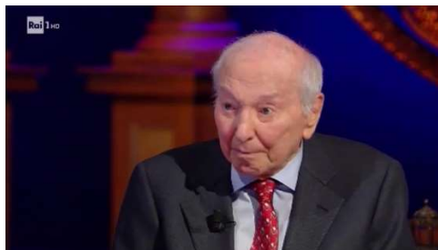
PIERO ANGELA, FONDATORE DEL CICAP

Piero ANGELA si interroga quindi sul motivo per il quale ampie fasce della popolazione tendono a diffidare delle Istituzioni e Massimo POLIDORO argomenta che si tratta soprattutto di persone che non hanno gli strumenti culturali per difendersi in un mondo moderno così complesso e quindi tendono sempre a diffidare delle informazioni ufficiali.