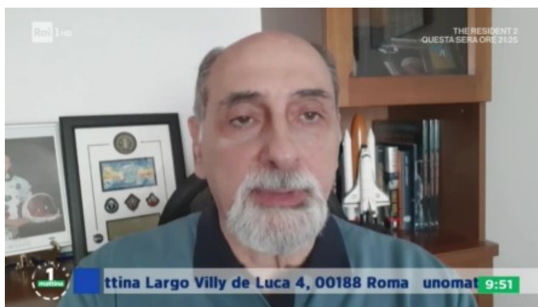
Umberto GUIDONI (ex astronauta)

In collegamento video dall'esterno l'ex astronauta Umberto GUIDONI (apparso un po' provato) ha dichiarato : ”Io come astronauta sono stato due volte nello spazio ma non ho mai visto oggetti volanti non identificati per cui sono scettico sugli U.F.O..”