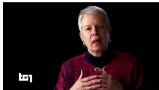
Jill TARTER (radioastronoma SETI INSTITUTE)

L'astronoma senior del SETI, Jill TARTER (alla cui vita il regista del film "Contact" del 1997 si è ispirato per il personaggio della radioastronoma Ellie Arroway interpretato da Jodie FOSTER) ha ammesso che gli scienziati non hanno ancora un'idea precisa di come trovare la vita extraterrestre ma scrutando il cielo potranno captare segnali radio emesse da civiltà extraterrestri avanzate disperse nell'Universo. "Ascoltare segnali radio intelligenti non ci consentirà di instaurare un vero "dialogo" con gli Extraterrestri ma ci potrà insegnare molto su di loro."