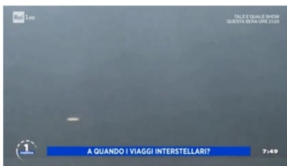
U.F.O. a Bordighera (IM) ?