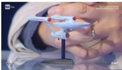
astronave di Star Trek

A tal fine viene mostrato un modellino dell'astronave Enterprise della serie televisiva Star Trek. Tale modello si potrebbe spostare nello spazio grazie ad un motore c.d. "a curvatura" (dello spazio-tempo). Ma non si tratta di fantascienza ma di Scienza: la N.A.S.A., l'agenzia spaziale americana, avrebbe già allo studio un simile motore "a curvatura", che consentirebbe di viaggiare a velocità superiore a quella della luce. Non è escluso che tra qualche decina o centinaio di anni di avrà finalmente la possibilità di viaggiare tra le stelle, il che risolverebbe il dubbio: perchè se esistono gli alieni non li incontriamo?