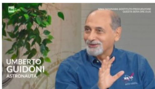
Umberto GUIDONI (ex astronauta)

Umberto GUIDONI, in qualità di astronauta dell'ASI che ha volato a bordo degli Space Shuttle della NASA, ci tiene a precisare che la US Navy ha solo riconosciuto la provenienza dei filmati dai propri archivi, senza avanzare nessuna ipotesi circa l'eventuale natura extraterrestre di quelli oggetti. Si tratta di immagini riprese all'infrarosso e quindi quello che si vede non è tanto la sagoma dell'oggetto quanto piuttosto la sua traccia termica, la sua scia di calore e potrebbe pertanto trattarsi della scia di qualche aeromobile convenzionale.