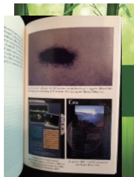
gli UFO della Cina