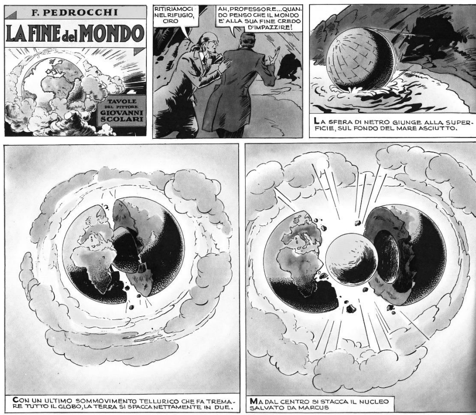
"SATURNO CONTRO LA TERRA"

Quella di "rompere il pianeta come una noce" è una curiosa iperbole che il buon Nick Pope probabilmente non conosce ma che già nel lontano 1946 in Italia i fumettisti Pedrocchi e Scolari avevano ipotizzato! Nell'ultimo episodio della serie "Saturno contro la Terra" i due autori immaginano che gli abitanti di Saturno riescano ad aprire in due il nostro pianeta, proprio come la noce di Pope...!!