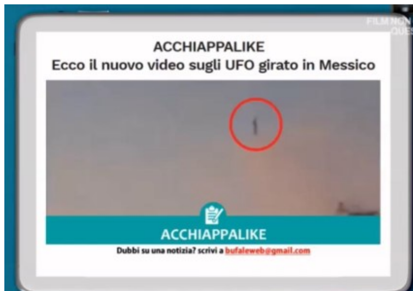
presunto umanoide volante del Messico