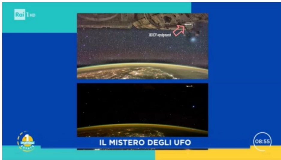
il presunto UFO della stazione ISS