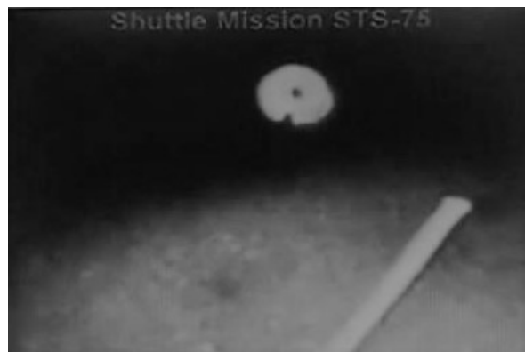
L'UFO della missione STS 75

A tal proposito ricordiamo che Umberto GUIDONI, insieme all'altro astronauta italiano Maurizio CHELI, ha partecipato alla missione Shuttle STS 75 della NASA, svoltasi dal 22 febbraio al 9 marzo 1996. Durante quella missione l'equipaggio della navetta lanciò nello spazio il famoso Tethered TSS-1R, il "satellite con il filo". L'esperimento fallì per la rottura del cavo che teneva ancorato il satellite.