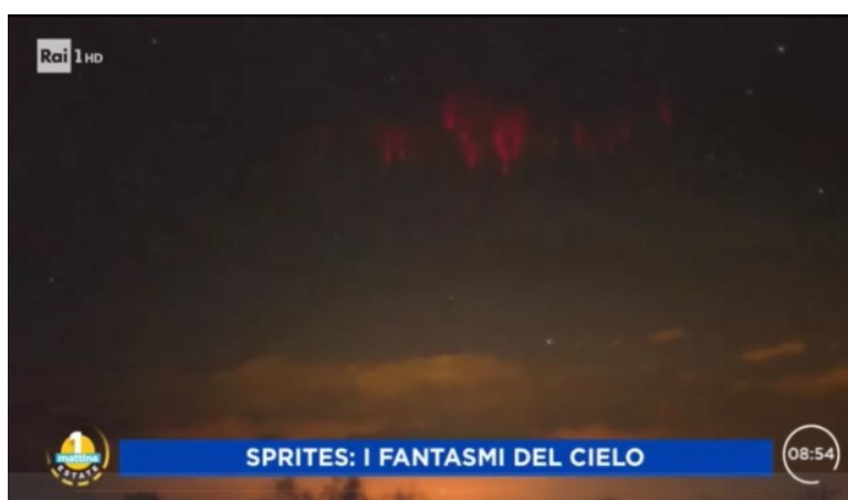
sprites o folletti

Un altro fenomeno singolare e molto più raro è invece quello degli “Sprites” o “Folletti”, gigantesche lingue rosse che si formano ad alta quota, sorta di fulmini al contrario, che lasciano ricadere particelle di colore rosso.