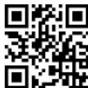
LEITMAN su UFO e Disclosure