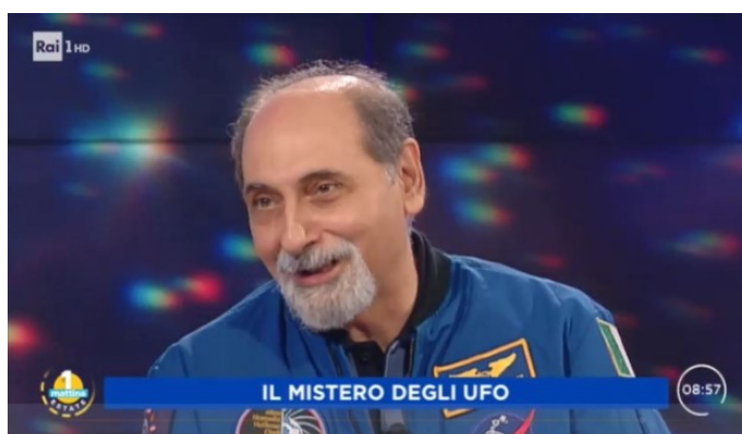
Umberto GUIDONI, ex astronauta

A questo punto la conduttrice ha spostato il discorso su un altro tipo di strano fenomeno che viene spesso visto in cielo dagli astronauti, quello degli U.F.O..