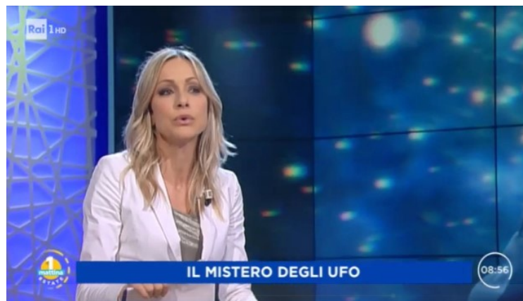
La conduttrice Mia CERAN