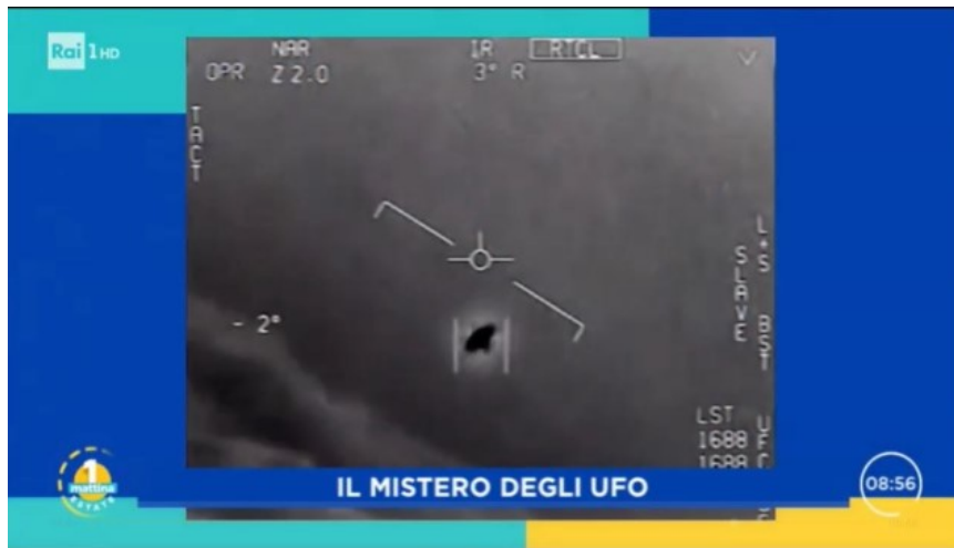
l'UFO della USS Nimitz (2004)